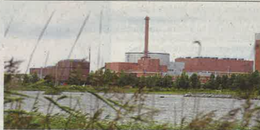
OLK3, le réacteur EPR qu'Areva construit pour TVO, en Finlande.